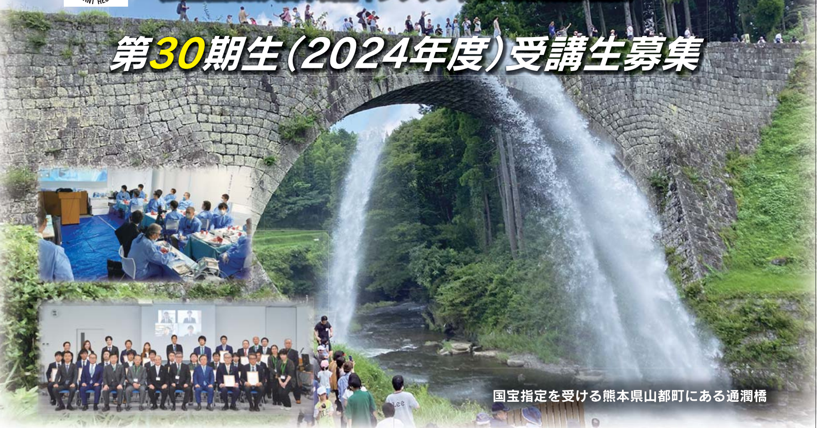
国宝指定を受ける熊本県山都町にある通潤橋